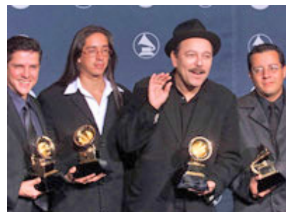
EDITUS acompañará a voces centroamericanas en el disco.