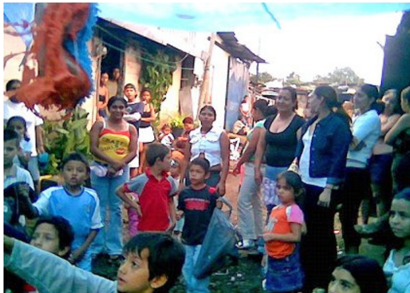
VECINOS Los Higuerones, en AAlajuela, recibieron piñatas de la Asociación Binacional en la navidad del 2006. (EC)

nicaragüense en Costa Rica, su gran fuerte.