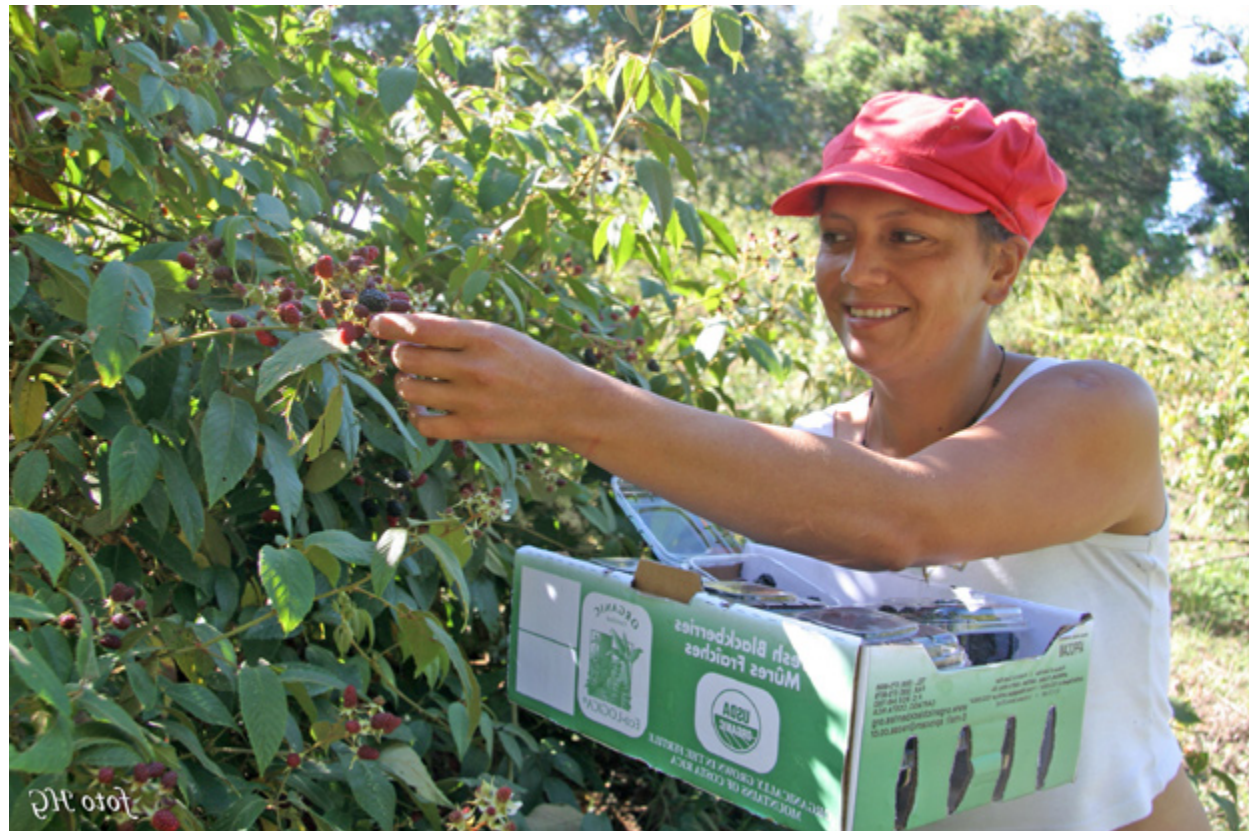
PARA FACILITAR EL ingreso de trabajadores nicaragüenses el gobierno de Costa Rica impulsa reformas en la ley de migración y el código laboral

Las direcciones de migración y extranjería de Nicaragua y Costa Rica, así como los ministerios de trabajo, coordinan la llegada de 41, 500 nicaragüenses suplir la necesidad de mano de obra, pero su traslado se ha retrasado. A eso se le suma la queja de los empresarios que dicen que la