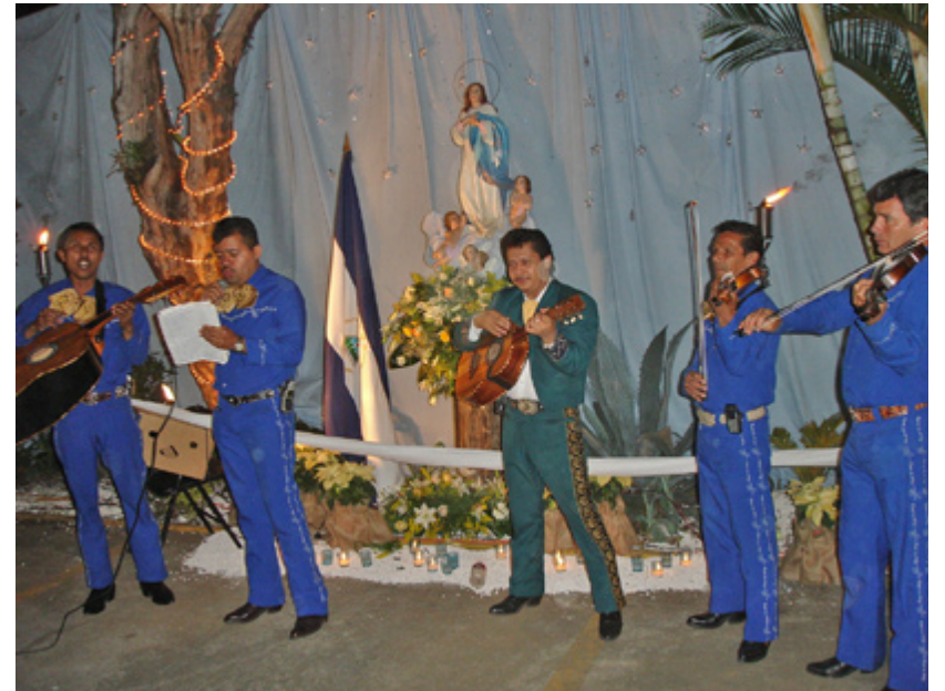
EL AÑO PASADO La Purísima fue celebrada en la sede de la Embajada de Nicaragua.