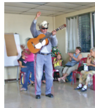
UN MARIACHI invidente interpretó alegres tonadas como El Pirulino(EC)

“El programa es educativo y da orientaciones de cómo comportarnos en un país que no es el nuestro”, añadió. Espinosa coincide con una de sus oyentes que el peor padecimiento del inmigrante es la cabanga y la depresión. “Este programa es como un paliativo que los oyentes esperan todos los días a las seis de la tarde”, explica.