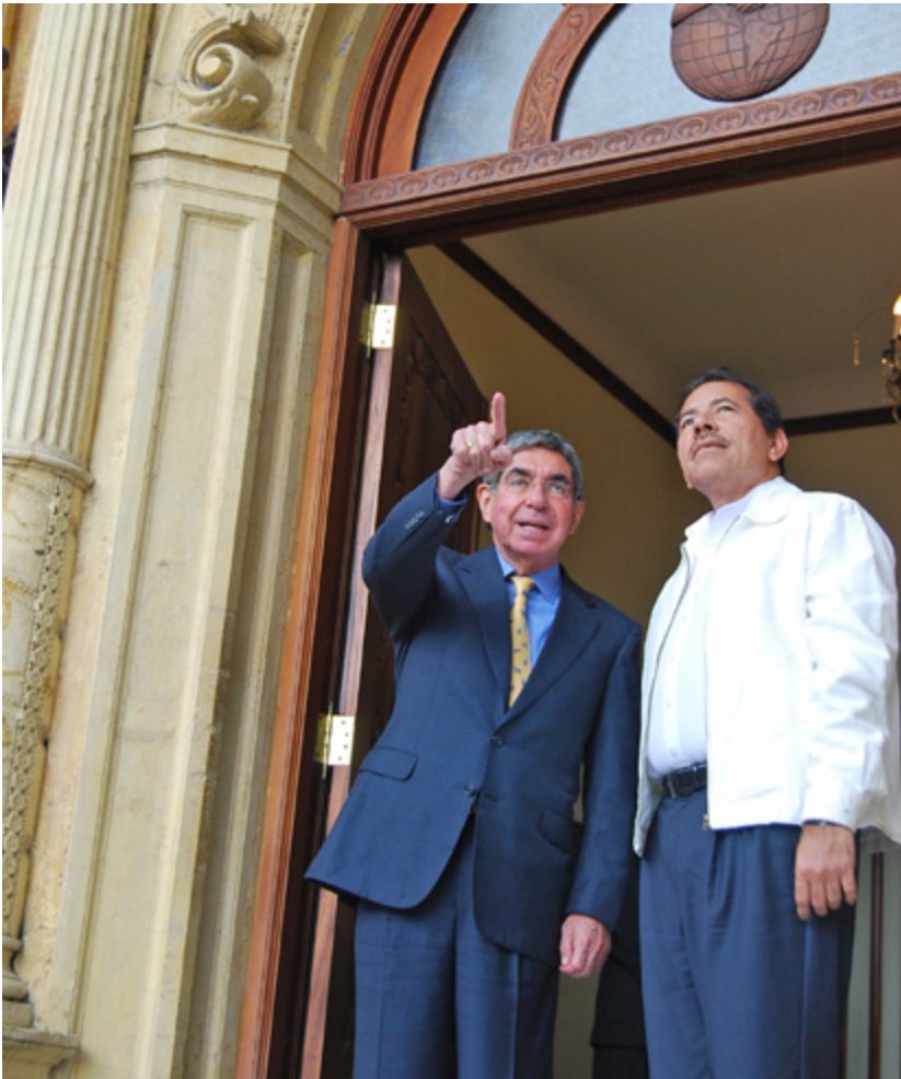
EL ENCUENTRO entre ambos mandatarios dejó entrever que están dispuestos en dejar de lado las diferencias personales.