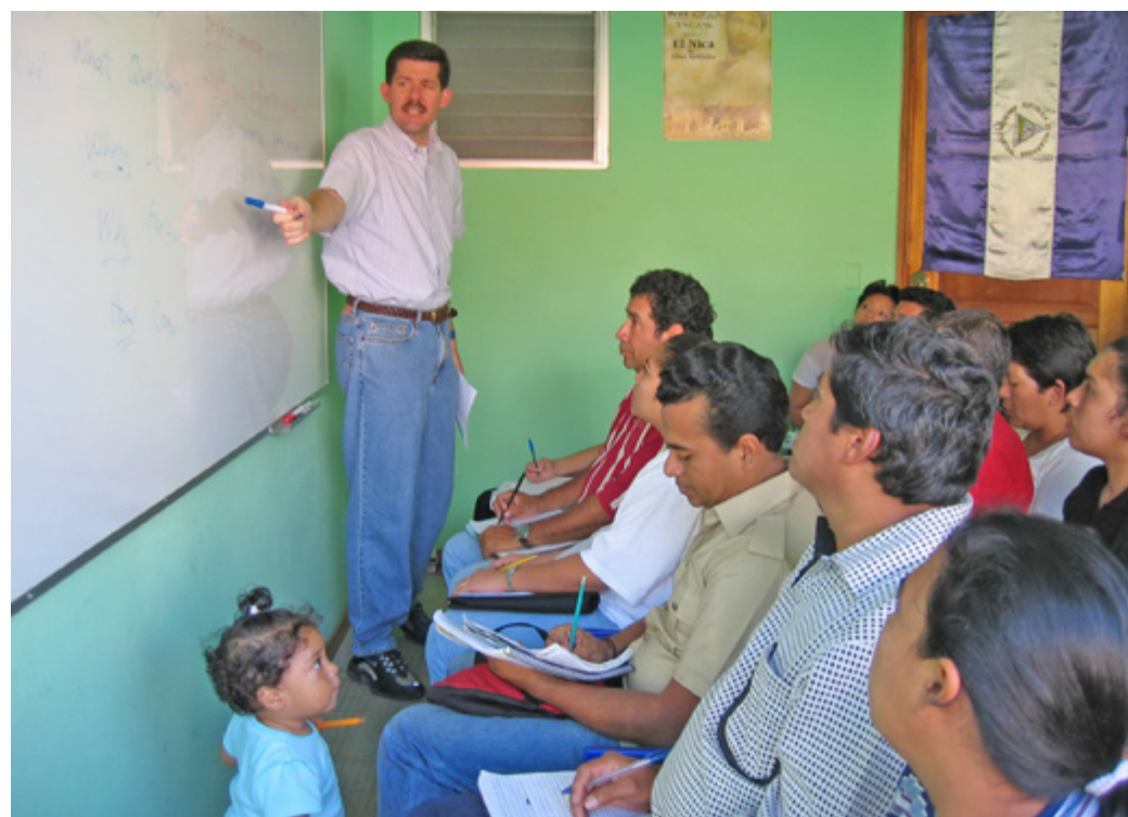
LOS MAESTROS de Alpacri son generalmente estadounidense pero también hay nicaragüenses.

Según comentaron Pérez y Leiva, este proyecto va más allá de la enseñanza, pues las charlas cristianas han procurado encuentro entre familias dispersas, los alumnos han apren-