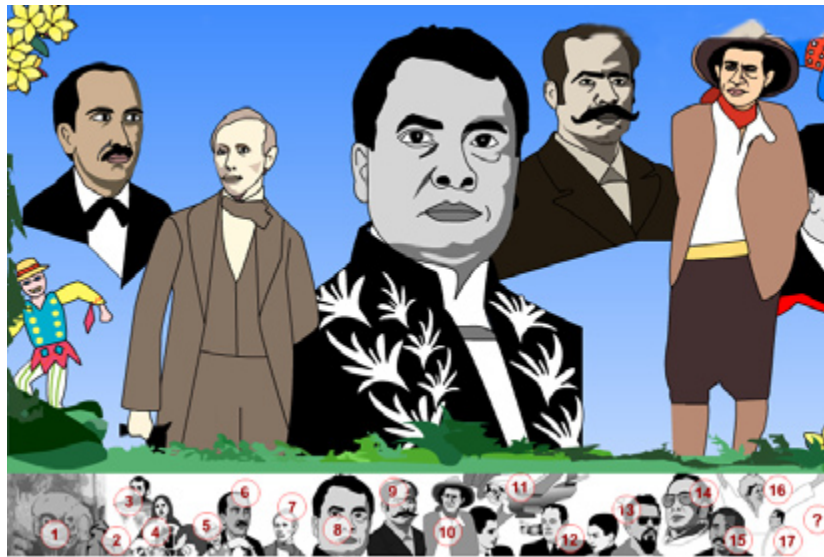
FALLOUT se influye de grandes muralistas mexicanos. La obra está disponible en http://transition.turbulence.org/Works/fallout/timeline.php (www.ambiente.com)

Como resultado, el artista obtuvo el proyecto de arte digital denominado Fallout y aunque la exposición se hizo hace meses, el proyecto sigue dando de qué hablar por su importancia en la historia de las artes digitales. El proyecto es impulsado por la productora neoyorquina Turbulence, especializada en arte digital. La obra digital logra sintetizar los motivos de la profunda crisis político económica que padece Nicaragua y la fractura social generada por los años