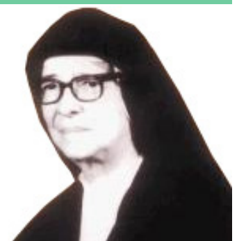
SOR MARÍA Romero (Casa Sor María R.)

En 2002 fue beatificada por el Papa Juan Pablo II al comprobarse el milagro de la niña costarricense Ma-