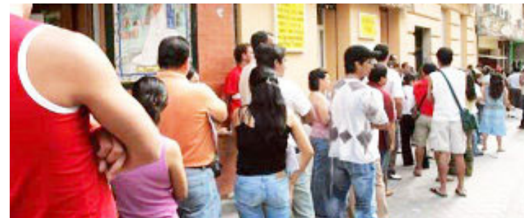
LATINOS realizan gestiones para legalizarse en España (EC)

Están optando por España, Italia, Canadá y lo hemos visto en Suramérica de una forma importante”, aseguró Bendixen.