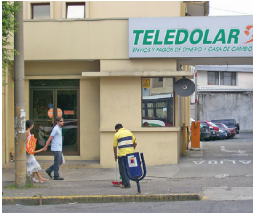
UNA DE LAS AGENCIAS DE TELEDOLAR en las que usted puede donar su juguete, es la ubicada al final de la Avenida Segunda, en San José.

En todas las agencias de Teledolar se estarán recogiendo regalos para estos niños, es por esta razón que se hace un llamado a todos clientes de TELEDOLAR para colaborar con la noble causa y crear sonrisas esta Navidad.