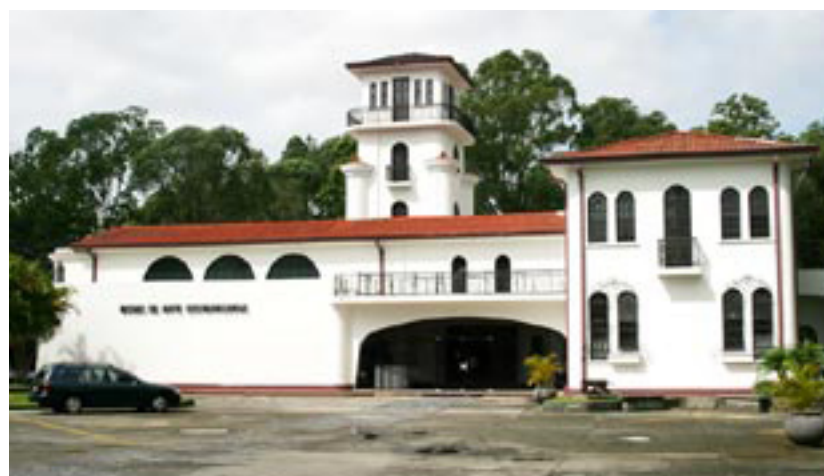
LOS GANADORES se anunciarán el 6 de marzo del 2008 en el MAC, donde también se hará una exposición de obras seleccionadas.