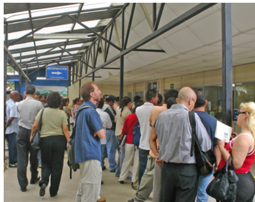
LA IMAGEN DE MIGRACIÓN Y EXTRANJERÍA ha mejorado por la frontal lucha contra la corrupción que libra el gobierno tico.

Los funcionarios detenidos desde hace algún tiempo habían otorgado cédulas de residencia a personas refugiadas y a indocumentados que al parecer entraron al país tiempo