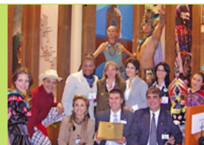
REPRESENTANTES DE TODOS LOS los países centroamericanos celebraron juntos el triunfo

Datos de la Organización Mundial del Turismo (OMT), indican que Centroamérica experimentó un incremento del 7 por ciento en el turismo durante los primeros tres meses de 2007, superando las estadísticas en el continente americano, el cual ha recibido un 4 por ciento más de turistas.