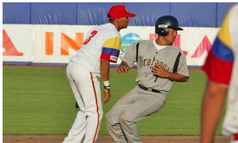
NICARAGUA QUEDÓ de sexta en el Mundial de Holanda 2005.

El Centroamericano periodicoelcentroamericano@gmail.com