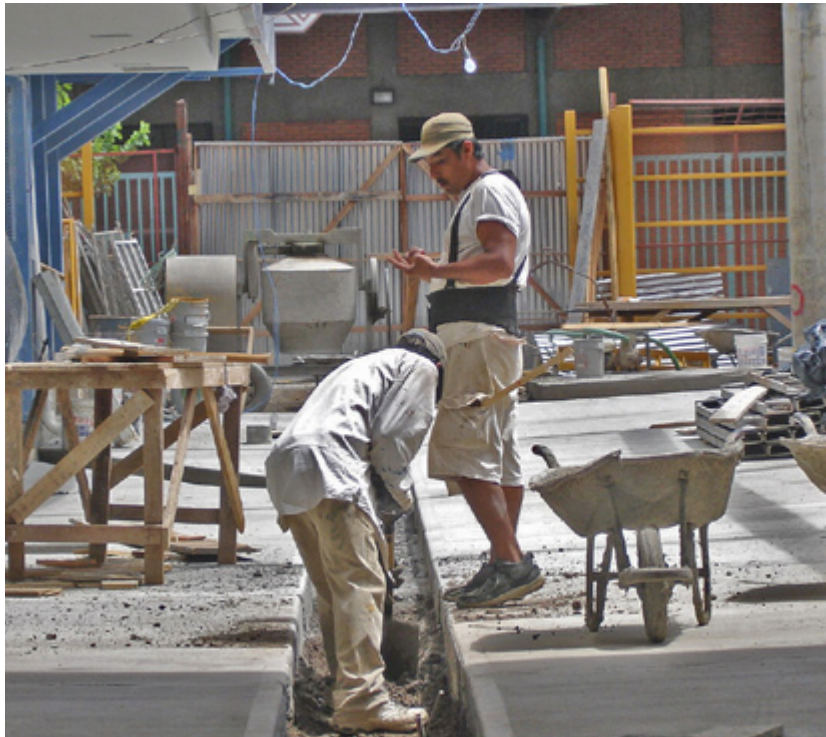
EL SECTOR CONSTRUCCIÓN creció un 18 por ciento el respecto al año anterior; y se ubica en el área de más crecimiento.