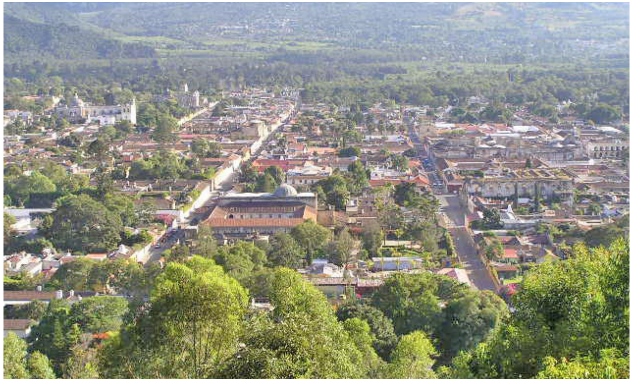
VISTA PANORÁMICA de la ciudad de Antigua Guatemala, en Guatemala

Según el plan de gobierno presentado en la campaña, el presidente electo se ha comprometido a profesionalizar la policía para bajar de 15 a tres los homicidios diarios. También