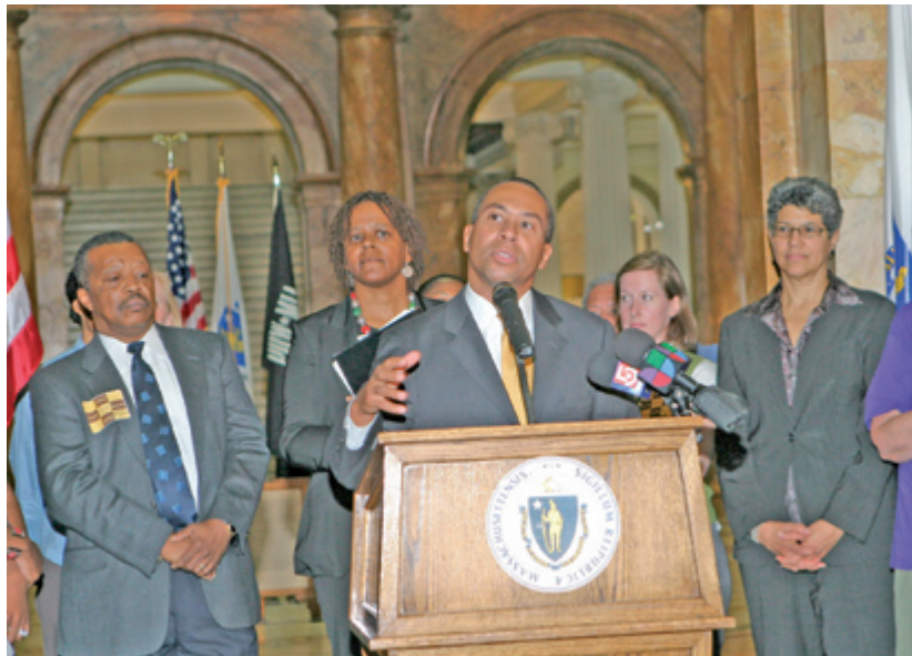
EL GOBERNADOR DAVIL PATRIC , al declarar a Massachussets como el primer Estado que brinda seguro social a todos sus habitantes independientemente de su origen.

Las personas que comprueben que tienen la Green Card , cédula de residencia u otro estatus legal migratorio,