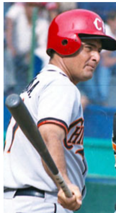
PRÓSPERO GONZÁLEZ acumuló 58 jonrones, 1,025 carreras anotadas y 1,135 remolques, son cifras que permanecerán intactas por largo tiempo.

El futuro de Nicaragua en estas competiciones es incierto. Desde 1996 no se participa en una olimpiada y ya no es invitada a Copas Internacionales. El béisbol nica decrece y lo peor de todo, es que el Estado no invierte mucho en el deporte.